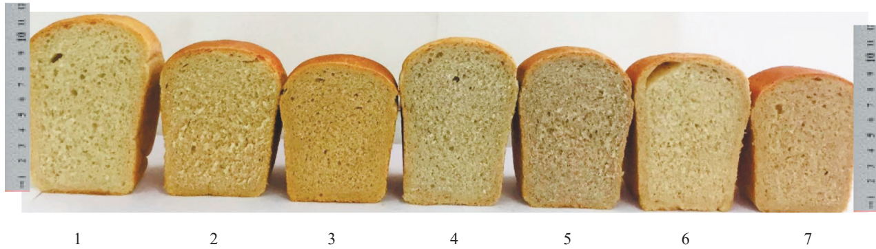
Рисунок 2. Внешний вид выпеченных изделий в разрезе: 1 – контроль; 2 – 2 % порошка Cordyceps militaris , выращенного на субстрате из зерна бурого риса; 3 – 4 % порошка Cordyceps militaris , выращенного на субстрате из зерна бурого риса; 4 – 2 % порошка Cordyceps militaris , выращенного на субстрате из зерна красного риса; 5 – 4 % порошка Cordyceps militaris , выращенного на субстрате из зерна красного риса; 6 – 2 % порошка Lentinula edodes ; 7 – 4 % порошка Lentinula edodes